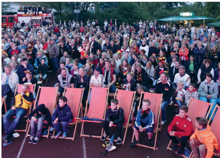
Höhepunkt unserer WM: Public Viewing in Appen

BADMINTON · FUSSBALL · HANDBALL JUDO · TENNIS · TISCHTENNIS · TURNEN