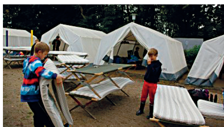
Echte Hausmänner: Iven und Elias zeigen ihre Qualitäten beim allgemeinen Aufräumen.

verstreichen ließ, das rasch aufziehende Gewitter zu spät bemerkte und somit als Rudel begossener Pudel im Zeltlager ankam. Ein toller Anblick! Zurück im vom Monsun mittlerweile überfluteten Zeltlager bereitete man sich unterdessen auf den Grillabend vor: während die „Großen“ die Würstchen grillten und einige Kilogramm Rohgemüse in mundgerechte Portionen schnippelten, konnten einige Kinder vom kühlen Nass einfach nicht genug bekommen und errichteten in den neu entstandenen Bächen auf dem Zeltlager moderne Staudämme. Nach der herzhaften Stärkung machten wir es uns im (trockenen!) Speiseraum gemütlich, schauten einen Disney-Film an und fielen anschließend müde in die Kojen.