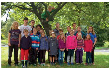
Neukirchen-Team 2014: Auf dem Heimweg wird schnell noch das Gruppenfoto geschossen.

Auch für die kommenden Wochen und Monate stehen in der Judoabteilung so allerlei Aktivitäten auf der Agenda. Ab Mitte September beginnen wir an den Wochenenden gezielt mit den Vorbereitungen auf anstehende Gürtelprüfungen. Neben der Teilnahme an auswärtigen Wettkampftagen (u.a. Pinneberger Bärenturnier) stellen wir ein Programm für das Distelkamphallen-Jubiläum im November zusammen und üben es für die öffentliche Präsentation der einzelnen Sparten ein. Eine Woche nach dem Hallenjubiläum steht schließlich noch der daheim stattfindende 7. RellApp-Cup vor der Tür, der gemeinsam mit dem Rellinger TV organisiert wird. Die genauen Daten und Übungszeiten kann man auf den Internetseiten der Judoabteilung einsehen.