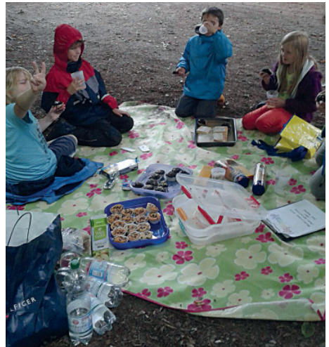
Rastpause bei der Neukirchen-Rallye: Kuchen und Kekse warten darauf, vernascht zu werden.