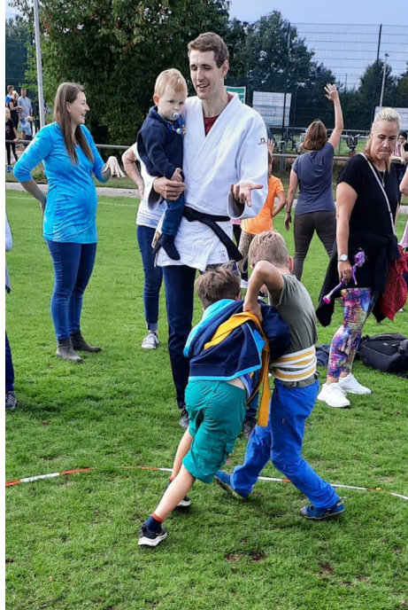
Sichtlich viel Einsatz zeigten diese beiden Nachwuchskämpfer bei unseren Ringen- und Raufen-Spielen auf dem Jubiläumsfest.