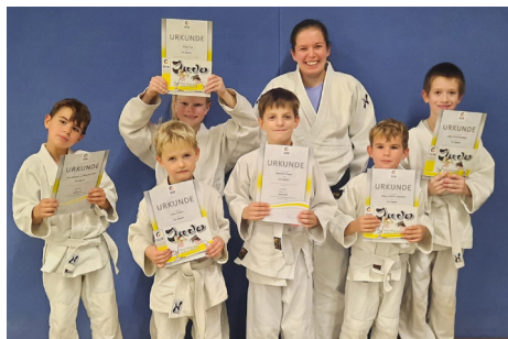
Erleichterte Gesichter nach bestandener Gürtel- prüfung. Herzlichen Glückwunsch!